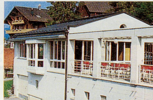
Die Cafeteria steht allen offen, auch denen, die sich nur ein bisschen ausruhen wollen.

Die Cafeteria steht allen offen. Auch für jene, die sich nur ein bisschen ausruhen möchten, ist dort Platz, es besteht kein Konsumationszwang. Sobald es