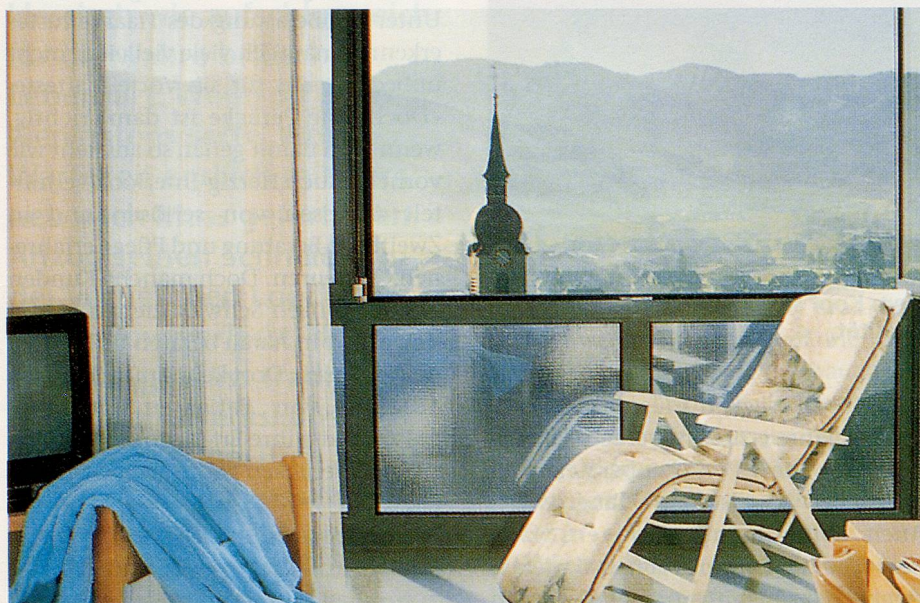
Im Annahof Aegeri kann man die Ruhe geniessen und sich in schöner Umgebung erholen. Bild: Blick aus einem Zimmer auf Unterägeri.