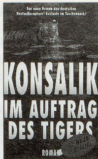
Heinz G. Kosalik Im Auftrag des Tigers Roman Wilhelm Heyne Verlag München, 351 S., Fr. 12.80

«Mein Name ist Jean von Watteville. Ich bin fünfundsiebzig Jahre alt, doch ich bin achtzehn, als ich diesen Traum habe und mich mein Onkel von seinem Landsitz in Ussière gejagt hat.» So beginnt Jacques Chessex' Erzählung «Voltaire's Traum», die im Jahr 1760 spielt. Jean von Watteville ist von Herrn Clavel, einem Freund seines verstorbenen Vaters, in dessen Familie aufgenommen worden. Jeden Sommer werden mehrere Wochen auf dem Herrnsitz in Ussière am Genfersee verbracht. Hier gibt sich eine illustre Gesellschaft ein Stelldichein: Albrecht von Haller, Casanova, Rousseau. Besonders ungeduldig wartet man auf Voltaire, der im nahen Fernelly residiert und die Clavels häufig mit seinen Besuchen beehrt. Sein aufgeklärter Geist und sein sprühender Witz zieht alle in seinen Bann. Doch Jean zweifelt an dieser glatten Oberfläche. Überall wittert er Brüche und Doppelbödigkeiten. Heimlich verliebt in die schöne Dienstmagd Aude, beobachtet er sie eifersüchtig, bis es zum Eklat kommt und er aus dem Haus gejagt wird – und ins Leben fällt. Eine Erzählung voller Heiterkeit und Poesie. ny