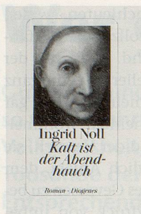
Ingrid Noll Kalt ist der Abendhauch Roman Diogenes Verlag Zürich, 246 S., Fr. 36.–

Ingrid Nolls neuestes Buch ist ebenso abgründig wie ihre Bestseller «Der Hahn ist tot» oder «Die Häupter meiner Lieben», mit denen sie zu einer der erfolgreichsten Krimi-Autorinnen Deutschlands avanciert ist. Auch in «Kalt ist der Abendhauch» liefert die Autorin nicht nur ein einfühlsames Familienpsychogramm, sondern einen spannenden und unterhaltsamen Kriminalroman. Weit mehr als die Leichen interessieren dabei die Mechanismen, die zu den Dramen des Alltags führen können. Im Mittelpunkt steht die 83jährige und noch sehr rüstige Charlotte, die ihre Familienprobleme schon mehrmals auf eigenwillige Weise gelöst hat. Nun hat sich jemand Besonderes angekündigt: Hugo, ihr Schwager, für den sie zeit ihres Lebens eine Schwäche hatte. Sollten sie doch noch einen romantischen Lebensabend miteinander verbringen können? Mit ängstlicher Sehnsucht schmiedet Charlotte Pläne, doch vor allem steigen Erinnerungen an ihre bewegte Vergangenheit auf. Wie die lebenskluge Frau mit Witz und Charme schliesslich ihren letzten Trumpf ausspielt, sei hier nicht verraten. ny