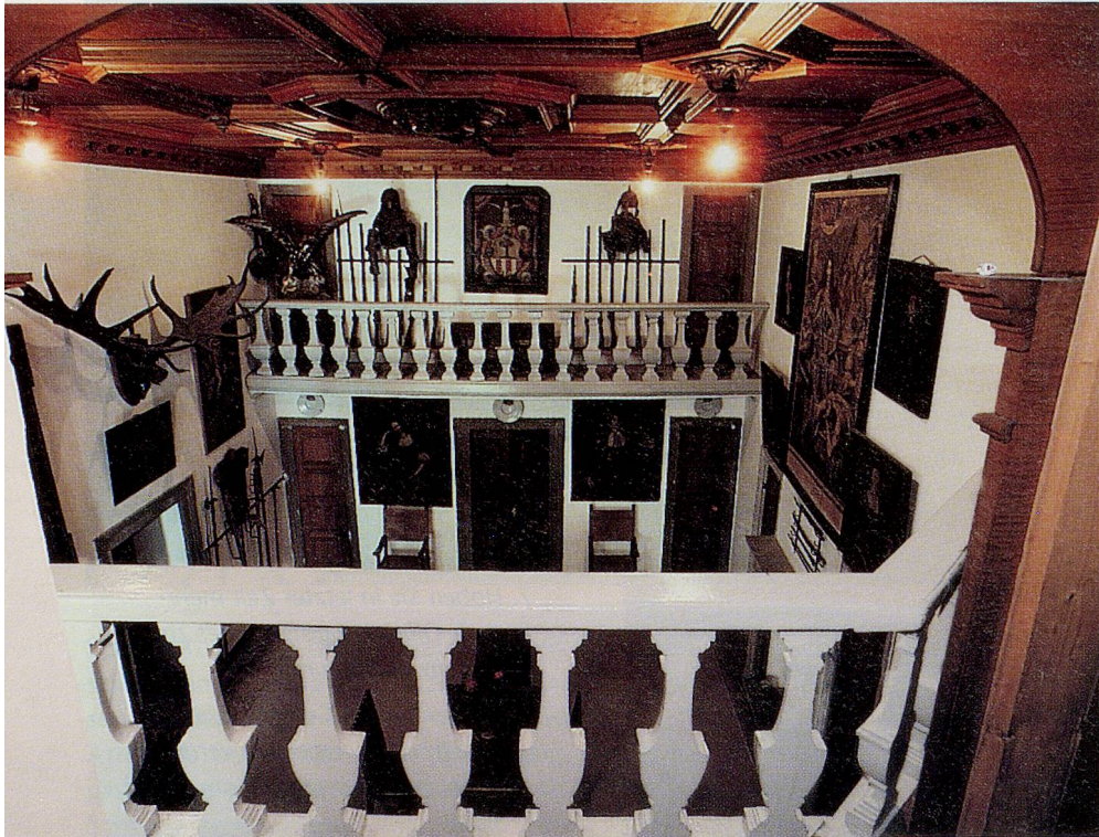
Im Innern des «Hauses von Salis» in Soglio.