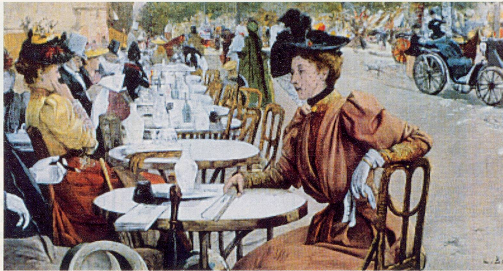
Kaffee trinken «auf der Strasse» gehört ab 1900 zum Lebensstil der modernen Frau. Bild: «Ein Frühlingstag auf den Pariser Boulevards», Illustration aus «Kaffee und Kaffeehaus» von Ulla Heise.

A propos Anthropologie: Der Mensch ist ein soziales Wesen, und nirgendwo sonst kommt er so selbstverständlich für eine halbe Stunde mit völlig Unbekannten zusammen wie im Café. «Es ist das Hineinhorchen auf Zeit in ganz andere Lebensschicksale», sagt mir eine Bekannte. Sie wüsste notfalls, wie in der Wüste zu überleben und auch wie in der Arktis. Nicht jedoch wie ohne das Café. «Auch wenn ich, ausnahmsweise, einmal allein bin – im Café bin ich dennoch nie allein.» Unbekannte begegnen sich ganz ohne Verpflichtung, was nirgendwo sonst möglich wäre. Es ist diese Unverbindlichkeit, diese herrliche Freiheit des Alleinseins mitten unter Leuten oder hinter Zeitungen und Illustrierten, die das Glück des Kaffeehausbesuchs ausmacht. Und manchmal, vor allem in der grossen Stadt oder an bekannten Ferienorten, erlebt man hinter der Intimität der Kaffeetasse die halbe Welt, mit Japanisch, Holländisch, Amerikanisch-Englisch und Nordfriesisch-Deutsch am Nebentisch. Ein teures