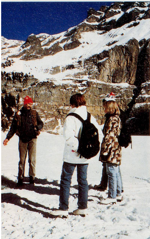
Am Oeschinensee: Neuerdings ist es erlaubt, hier im Winter zu fischen.