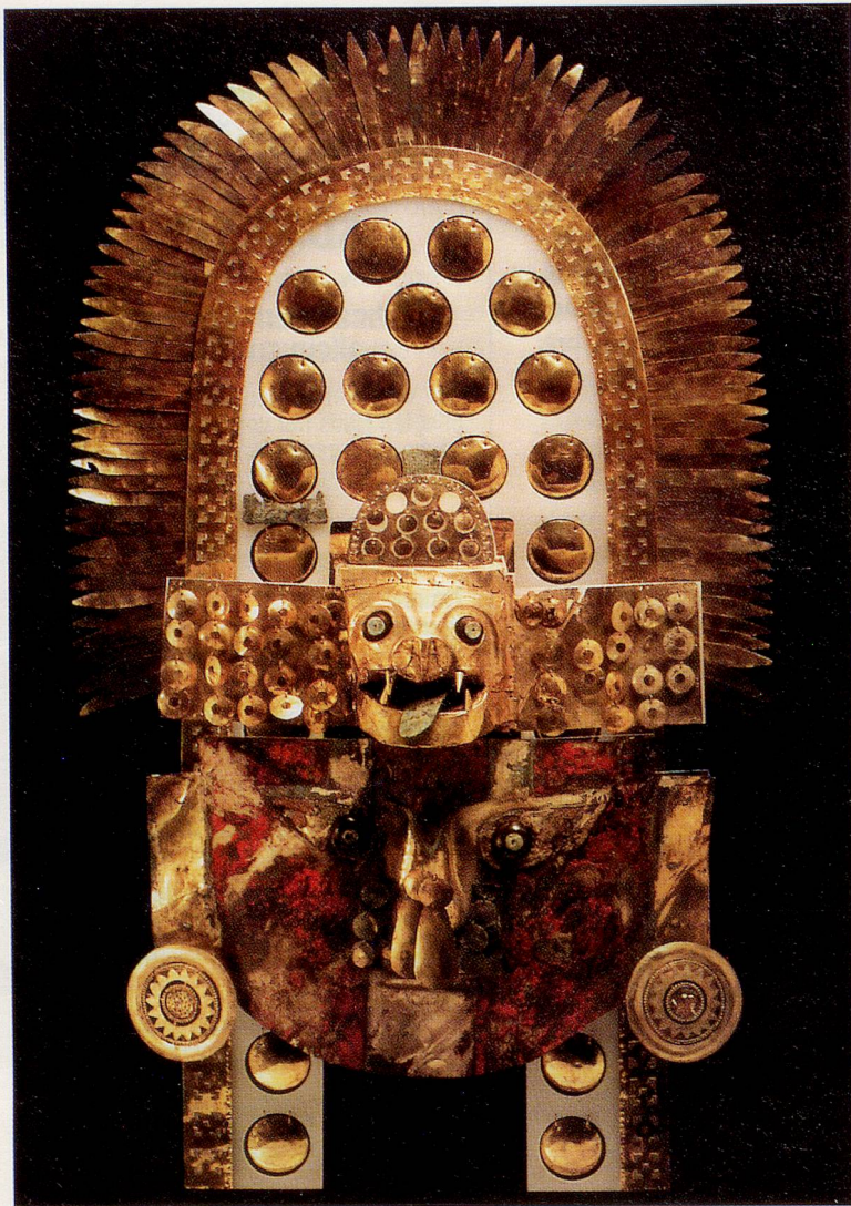
Sicán-Goldmaske aus dem Grab von Huaca Loro (rekonstruiert) 900 bis 1100

figürlichen Bildinhalten bemalte. Das zwischen den buntfarbigen Motiven durchscheinende Wismut verlieh der Malerei einen Hauch von Kostbarkeit. Vor allem Buchenholzkästchen, Kassetten und Truhen wurden in dieser besonderen Maltechnik verziert. Die Wismutmalerei kann bis ins späte 15. Jahrhundert zurückverfolgt werden. Die Blütezeit wurde im 16. und 17. Jahrhundert erreicht, im Laufe des 18. Jahrhunderts scheint die Technik in Vergessenheit geraten zu sein.