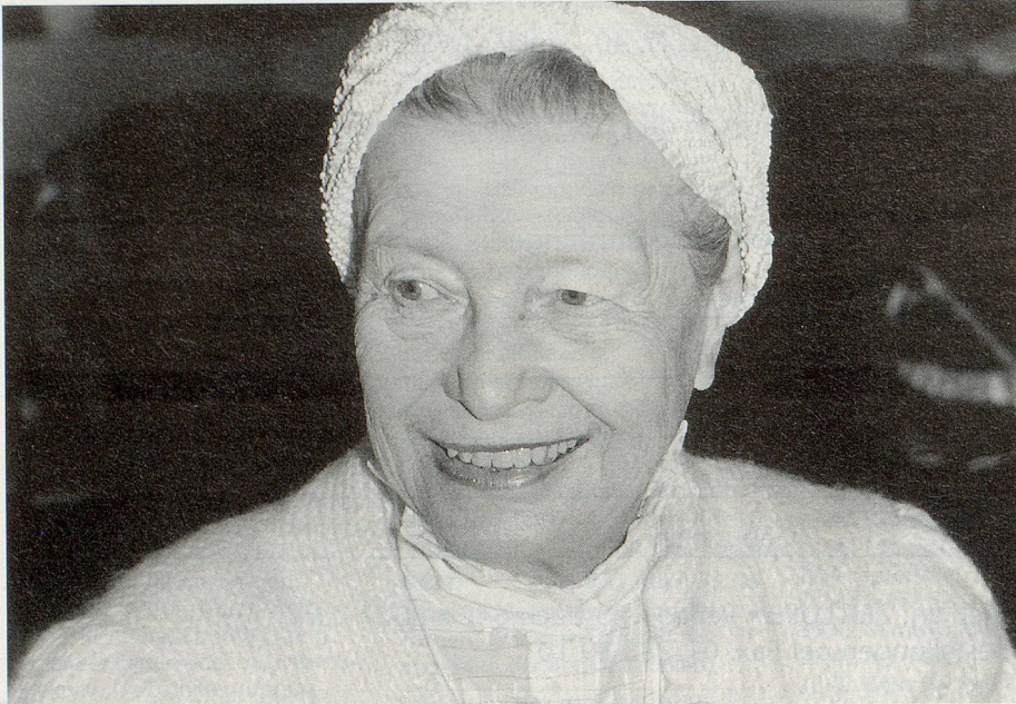
Die Schriftstellerin und Philosophin Simone de Beauvoir um 1975

Vor zehn Jahren, am 14. April 1986, starb eine der bedeutendsten Frauen unseres Jahrhunderts. Die französische Schriftstellerin und Philosophin Simone de Beauvoir schrieb unter anderem auch über das Alter, und zwar eines der umfassendsten Bücher, das je zu diesem Thema verfasst worden ist. Das 500 Seiten starke Werk hat bis heute nichts von seiner Gültigkeit und Faszination eingebüsst.