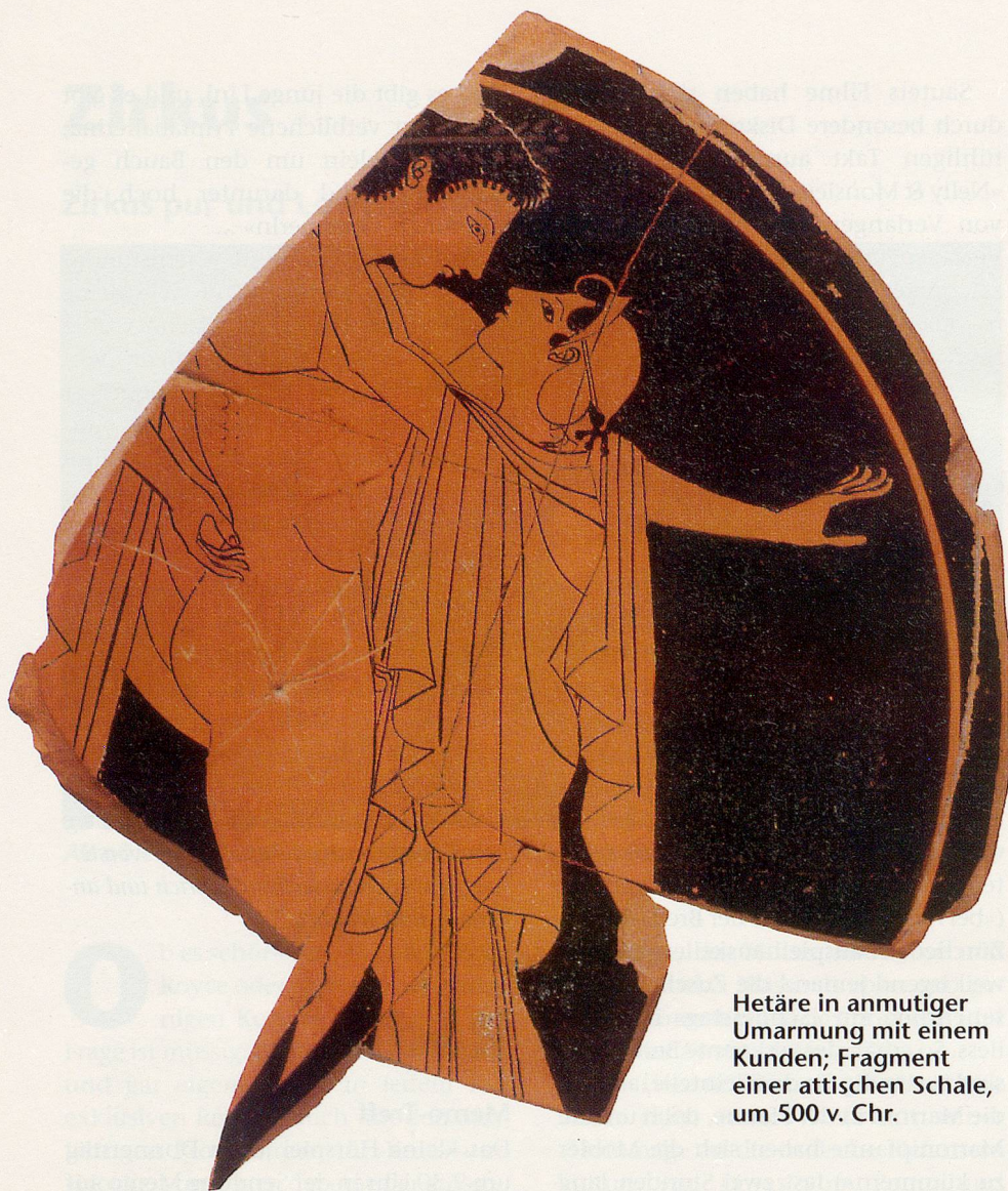
Hetäre in anmutiger Umarmung mit einem Kunden; Fragment einer attischen Schale, um 500 v. Chr.

kunst aus der berühmten Sammlung des New Yorker Metropolitan Museum of Art zeigt und die gesellschaftliche und politische Bedeutung dieser Kunstformen betont. Der grosse poetische Reiz der gemalten Landschaften und Figuren lässt sich mehr geniessen, wenn man die Augen noch frisch und unverbraucht über die zarten Bildrollen schweifen lässt, um die oft nur sparsam angedeuteten Motive zu erkunden. Der anschliessende Besuch im Kunsthaus überwältigt durch seine geradezu pompöse Pracht. Die ausgestellten archäologischen Fundstücke aus Gräbern und Opfergruben stammen zum Teil aus bisher unbekanntem Kulturen, die neue Erkenntnisse über die chinesische Geschichte ermöglichen, aber den Forschern auch grosse Rätsel aufgeben. Chinaexperten werden beeindruckt sein, wie wunderbar die Bronze-, Ton-, Stein- und Jadeplastiken zur Geltung kommen, wenn sie derart grosszügig und stimmungsvoll präsentiert werden, wie dies im Kunsthaus der Fall ist. Die Werke von höchster künstlerischer Qualität bieten einen Rückblick auf 5000 Jahre chinesischer Vor- und Frühgeschichte, wie er bisher in Europa noch nie zu sehen war. ny