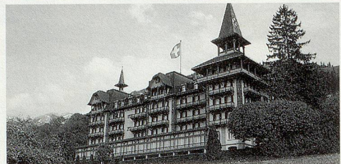
Renoviert/Zimmer mit Dusche/WC/Balkon/Selbstwahl-Telefon/Lift

CH-6073 FLÜELI RANFT • Tel. 041/660 22 33 • Fax 041/660 61 42 Heimat des hl. Bruder Klaus von Flüe/Zentralschweiz, 758 m ü.M.