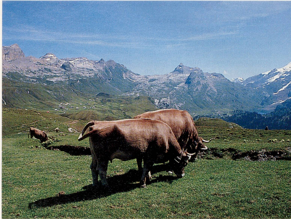
Nicht nur die Äpler, auch das Vieh ist auf der Wildi, wie Melchsee-Frutt heisst, glücklich. Bild: Wanderweg Erzegg-Tannalp, im Hintergrund Engstlensee und Titlis.

Im Gegensatz zu heute blieben sie den ganzen Sommer auf der Alp. Überall war eine gute, selbständige Frau, die sich um Kinder, Haus und Stall kümmerte, die auch für etwas Abwechslung bei der Nahrung auf der Alp sorgte, ein gutes Stück Speck oder «Meckli»-Fleisch mitgab. Hobby-Köche waren sie nicht, Magronen lösten gesottene Kartoffeln