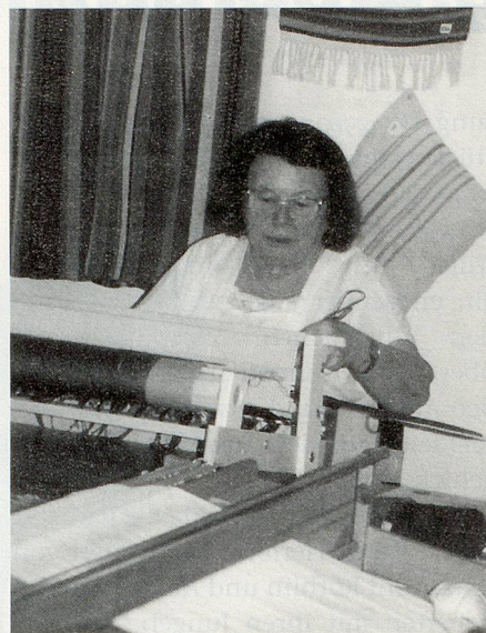
Weben an der Hobbyausstellung in Hausen a/A.