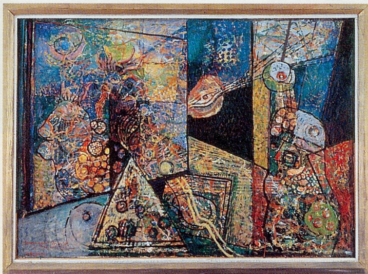
Hommage à Chirico, 1978, Acryltempera über Papiercollage auf Leinwand, 120x168 cm, Kunstmuseum Bern

Die Sonderausstellung «Modedesign Schweiz 1972–1997» im Landesmuseum in Zürich ist geöffnet bis 29. Juni, Di bis So 10.30–17 Uhr, 01/218 65 11.