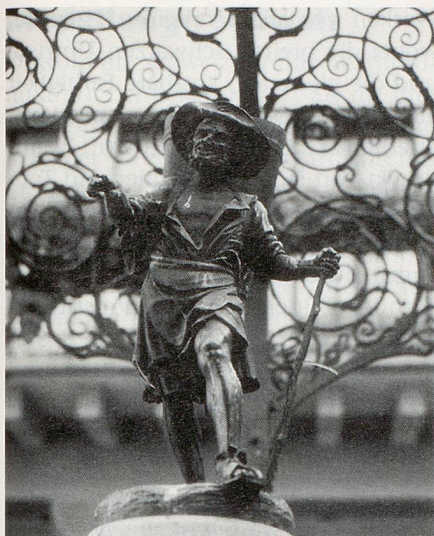
Zürich: Weinmarktbrunnen auf dem Weinplatz in der Altstadt.