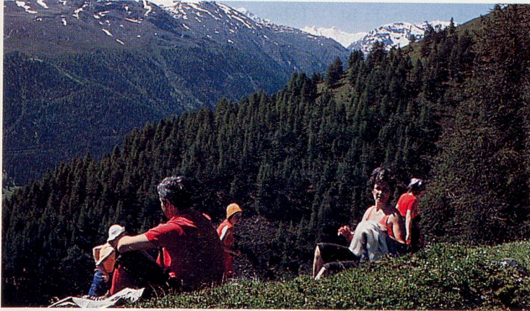
Die schöne Engadiner Bergwelt lädt zum Entdecken und Verweilen ein.