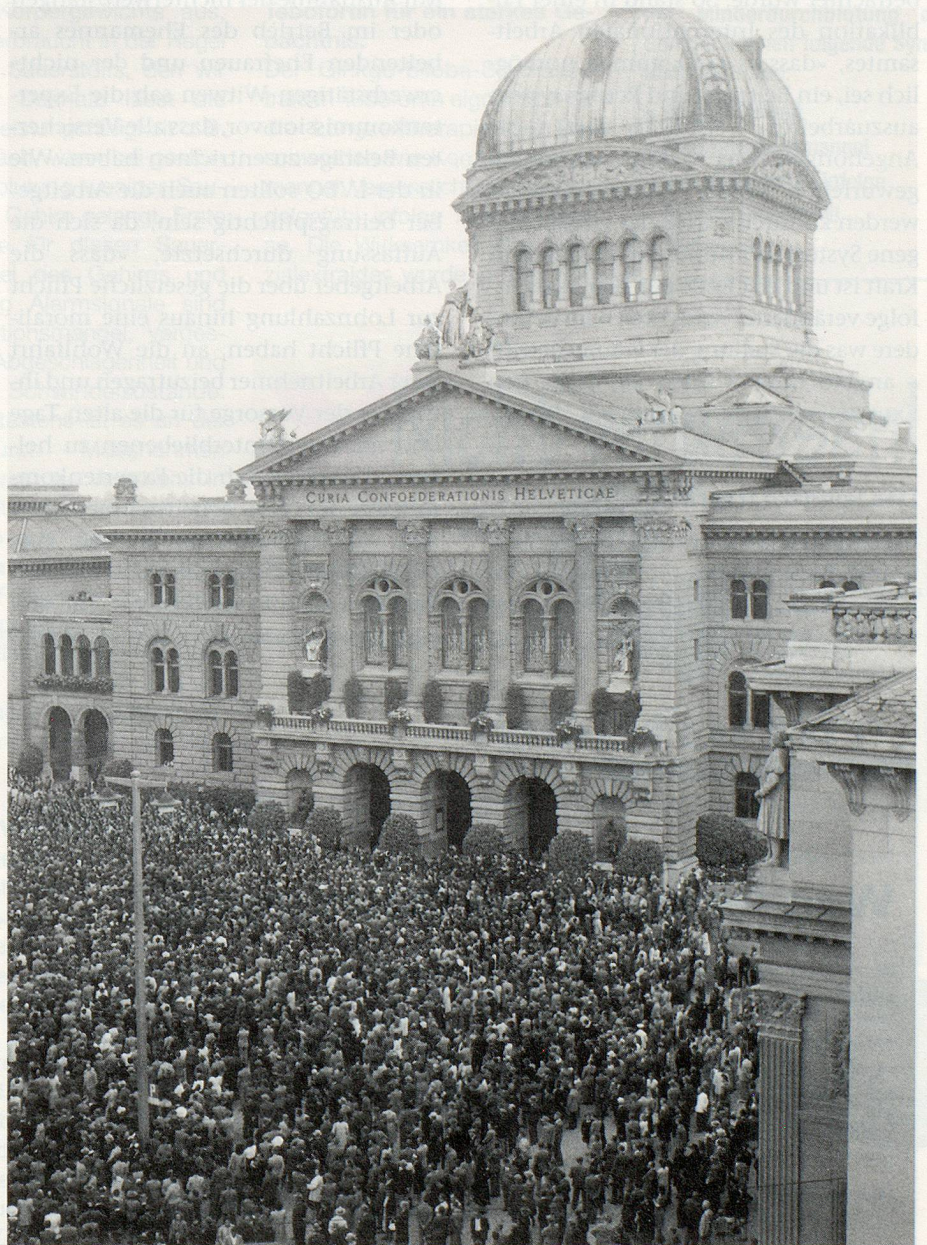
Grosskundgebung auf dem Bundesplatz in Bern am 2. Juli 1947 zur Abstimmung über die AHV und den Wirtschaftsartikel.