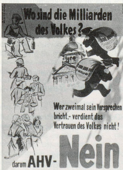
Am 6. Juli 1947 fand die Abstimmung über die AHV statt: 862 036 Ja gegen 215 496 Nein bei einer Stimmbeteiligung von über 60%. Einzig der Kanton Obwalden lehnte die Vorlage ab. Bild: Zwei Plakate des Abstimmungskampfes aus dem Jahre 1947.