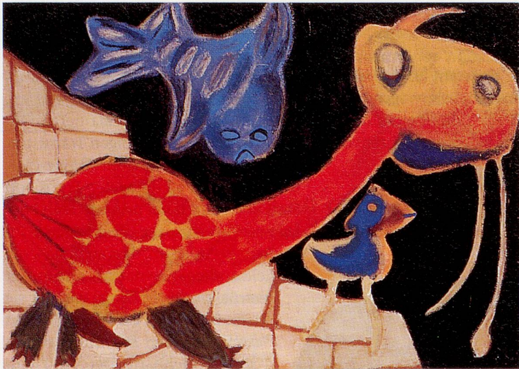
Knalliges Rot, Gelb und Blau eines Cobra-Werks von Carel Appel aus dem Jahr 1949: Tiere.

Das Kunstmuseum Lausanne vereinigt in einer Ausstellung rund 180 Gemälde, Zeichnungen und Skulpturen der nordischen Künstlergruppe Cobra. Der Name Cobra ist aus den Anfangsbuchstaben der drei europäischen Hauptstädte Kopenhagen, Brüssel und Amsterdam abgeleitet. Das waren die Zentren an der Peripherie, von denen aus die Cobra-Künstler nach dem Ende des Zweiten Weltkriegs gemeinsam agierten. Es ging um die Suche nach neuen Wegen, die weg von der klassischen Vorstellung der Malerei führten, jedoch nicht in die Richtung der geometrischen Abstraktion. Wichtige Impulse empfangen die Cobra-Künstler von Kinderzeichnungen, der Kunst von Aussenseitern und «primitiven» Kulturen. Bürgerliche Konventionen und Wertvorstellung und die künstlerische Moderne waren der Gruppe verhasst. Die wichtigsten Gestaltungsmittel für die kecken, ausdrucksstarken Werke waren knallige Farben, spielerische Phantasie, Humor und kämpferische Kraft. Die erste schweizerische Cobra-Retrospektive in Lausanne bietet bis zum 14. September einen Überblick über die Blütezeit der Bewegung (1948–1951), über ihre Vorläufer und ihre Auswirkungen auf das spätere künstlerische Schaffen in Europa. ny