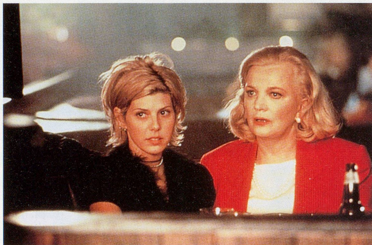
Szene aus dem Film «Unhook the stars» von Nick Cassavetes.

Jede und jeder von uns kennt sie, die Situation der Ablösung der Eltern von ihren Kindern: als Vater, Mutter, als Grosseltern, als Sohn oder Tochter. Nick Cassavetes, der 37jährige Sohn des verstorbenen Filmregisseurs John Cassavetes und der Schauspielerin Gena Rowlands erzählt in «Unhook the stars» (Ein Licht in meinem Herzen) eine solche Geschichte. Gespielt wird sie von seiner Mutter, der er die Story auf den Leib geschrieben hat.