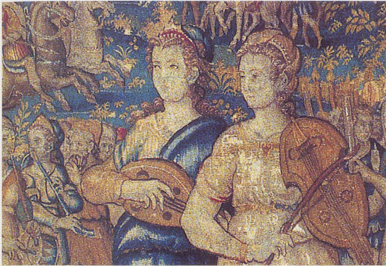
Ausschnitt aus einem belgischen Wandteppich aus dem 16. Jh. mit Bibelszene.