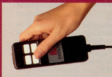
Das elektrische Steuergerät (auf Wunsch).