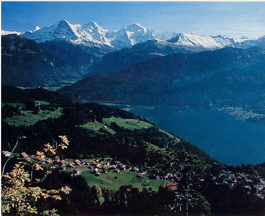
Aussicht vom Känzeli auf Beatenberg, Thunersee und Eiger, Mönch, Jungfrau.