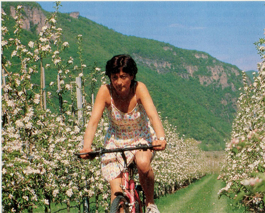
Im Frühling zeigt sich das Südtirol von seiner lieblichsten Seite.

Ab April bietet der Tourismusverband Südtirols geführte Velotouren im 2-Wochen-Takt. Es handelt sich um leichte, ungefähr 40-Kilometer-Touren mit Start in Eppan. Die Fahrt führt durch saftige Mischwälder und Weingärten, blühende Obstplantagen und idyllische Dörfer – vorbei an unzähligen landschaftlichen und kulturellen Besonderheiten. Kalterersee, Südtiroler Unterland mit Stärkungs-Zwischenstopp in Tramin und Auer lauten die weiteren Etappen. Den krönenden Abschluss bildet eine Weinverkostung mit herzhafter Südtiroler Speck-Marade auf einem Weinhof. Auf Wunsch bringt ein eigener Radtransport die Teilnehmer zurück nach Eppan. Für alle, die dort lieber wandern, bietet der Tourismusverband zudem den kostenlosen Prospekt «Wanderferien». Er enthält die schönsten Routen und attraktivsten Wander-Pauschalangebote dieser zauberhaften Gegend.