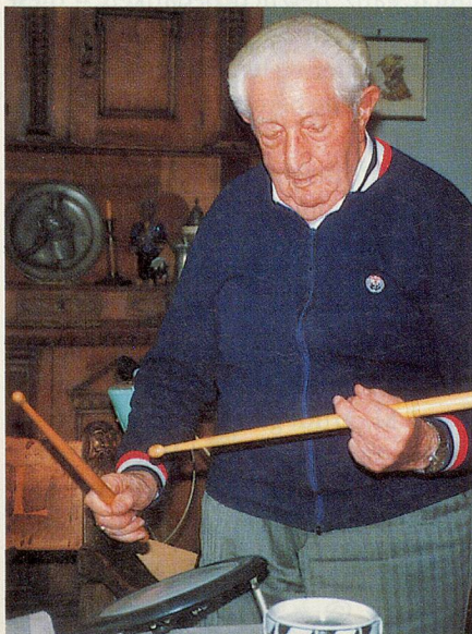
Konzentration beim Trommeln.

Da ist zum Beispiel Herr Jueni. Er lebt schon eine Weile im Heim. Er ist der einzige, der Handarbeiten macht, Gobelin-Bilder vor allem, zur Abwechs-