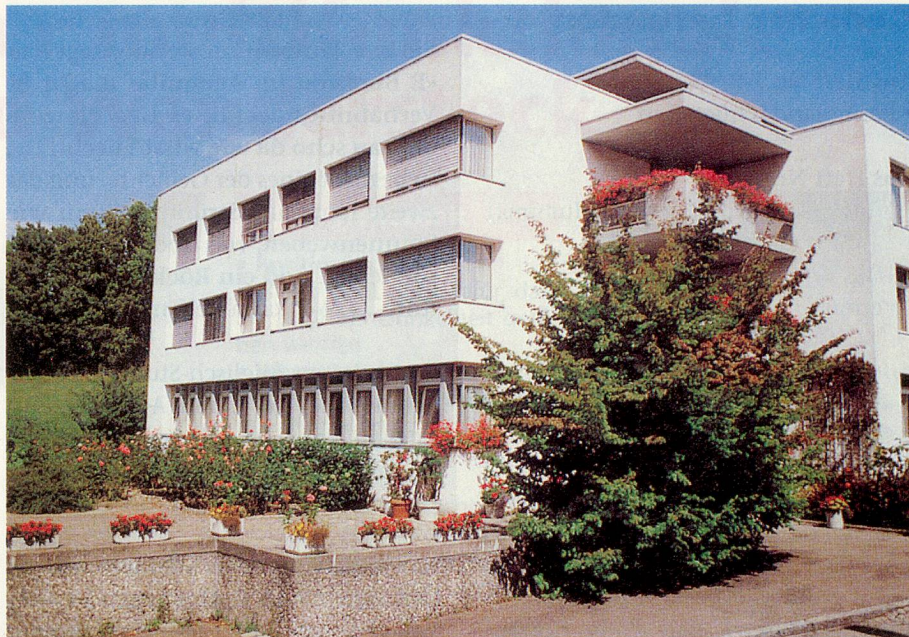
Altersheim Frohalp in Zürich Wollishofen.

lung aber auch einmal Kreuzstichmotive stickt für Kissen. Ihn hat die leidige Einkauferei zum Eintritt ins Heim bewogen.