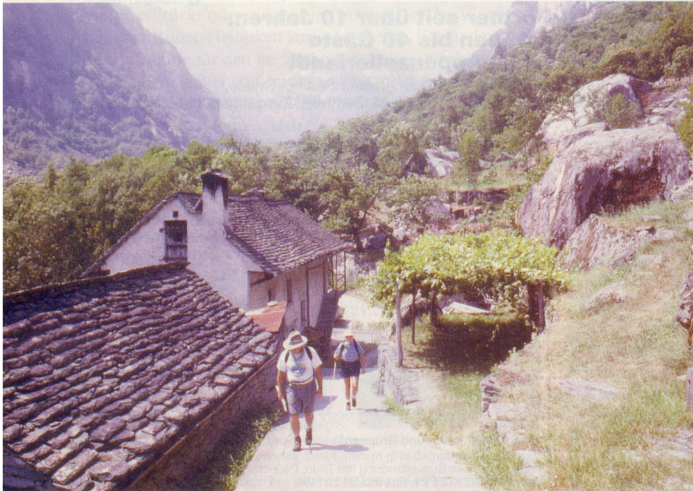
Unbelastet unterwegs auf dem «Sentiero del Sole».