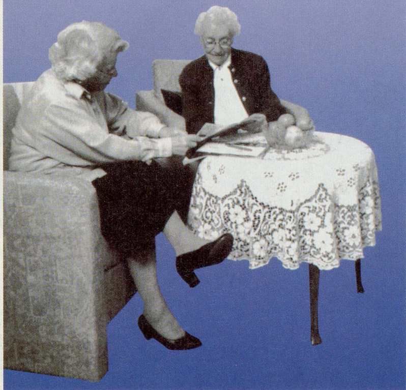
Stimmungsbild aus dem Prospekt eines Altersheims.

Es gibt nichts Besseres, um diese Wohnform wirklich kennenzulernen!