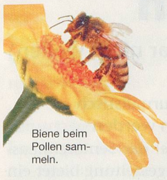
Biene beim Pollen sammeln.