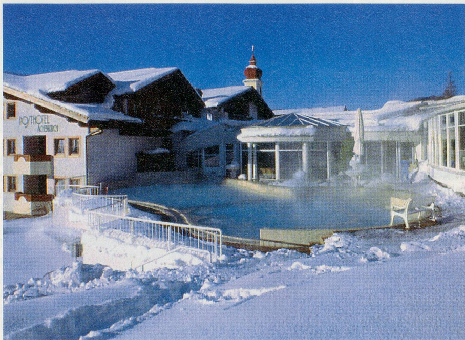
Luxus und Romantik: das geheizte Freibad im Posthotel von Achenkirch im Tirol.

Im zwischen Innsbruck und Kufstein gelegenen Tiroler Wintersportort Achenkirch offeriert ein Luxushotel Ferientage für höchste Erwartungen zu tiefen Preisen. Für rund 560 Franken pro Person erhält man dort vier Ferientage mit komplettem Arrangement. Dieses beinhaltet Doppelzimmer, Halbpension mit von Gault Millau gepriesener Küche und den Aufenthalt im Hallen- wie im geheizten Freibad, in den fünf Saunas oder dem Fitnessraum. Zu Spezialpreisen stehen ausserdem Tennis- und Reit-