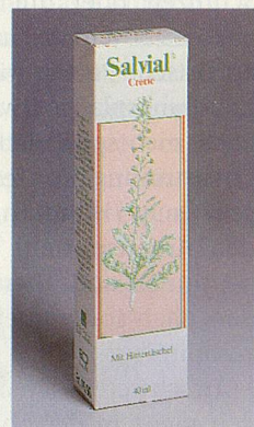
Unterstützt die Durchblutung der Haut.

Rote Hautflecken und durchschimmernde Äderchen sind meistens auf eine Erweiterung bzw. Erschlaffung der Hautgefässe zurückzuführen. Diese Störungen sind zwar harmlos, beeinträchtigen aber Ihr Aussehen und Ihr Wohlbefinden. Der in Salviaal Creme enthaltene Hirtentäschel-Extrakt (Capsella bursa pastoris) hat eine gefässaktivierende Wirkung und gibt den feinen Hautgefässen den natürlichen Tonus zurück. Durchschimmernde Äderchen sind oft auch Zeichen einer zu dünnen oder zu trockenen Haut. Zur Unterstützung der Therapie empfiehlt sich daher die Verwendung der Sanabil Ivo Vera Creme. Die Haut wird dadurch fester, und die Äderchen schimmern nicht mehr oder weniger durch.