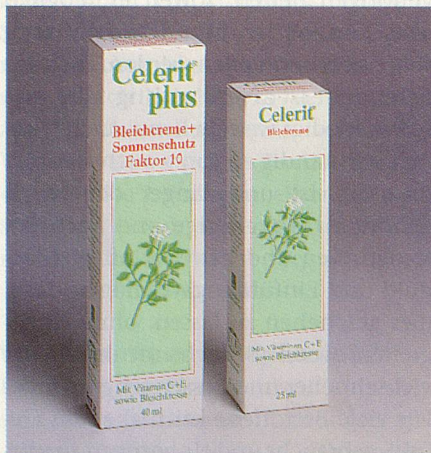
Schutz vor Pigmentflecken

Ihr gepflegtes und attraktives Aussehen ist Ihnen wichtig. Wären da nur nicht diese ärgerlichen Flecken auf Ihrer Haut. Grund genug, jetzt etwas gegen Pigmentflecken zu tun. Fragen Sie deshalb nach Celerit. Diese zuverlässige und sanft wirkende Creme wird bei Pigmentflecken von Fachpersonen empfohlen. Und das mit gutem Grund, denn Celerit bedient sich eines Fünffach-Wirkkomplexes von Aktivstoffen, die sich ideal ergänzen. Vitamin C und Bleichkresseextrakt hemmen die Entstehung neuer Pigmentflecken und fördern gleichzeitig den Abbau bestehender Flecken. Vitamin E beschleunigt den Abtransport überschüssiger Pigmente. Dexpanthenol dient der Rege-