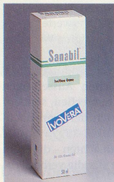
Feuchtigkeits-spender für die trockene Haut

Trockene Haut wird bei warmem Wetter und bei starker Sonneneinstrahlung zusätzlich strapaziert. Es wird ihr die für ihre Schutzfunktion notwendige Feuchtigkeit entzogen. Die Haut wird spröde, verliert ihre natürliche Spann-