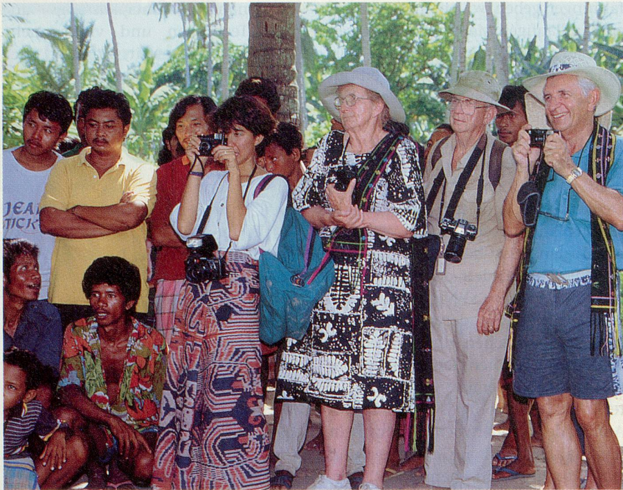
Heute sind Reisen in ferne Länder zur Selbstverständlichkeit geworden. Doch gerade ältere Personen sollten gewisse Vorsichtsmassnahmen treffen.