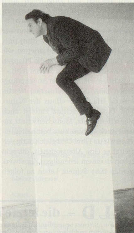
Hier führt Erwin Wurm selber eine seiner «ONE MINUTE SCULPTURES» vor.

Vorbereitung über die Ausführung der Skulpturen bis zu deren Dokumentation. Das Konzept einer «one minute sculpture» entsteht in Zeichnungen. In