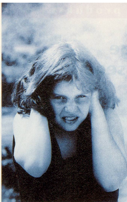
Akustische Überforderungen können Jahre später zu Hörschäden führen.

Bei der heutigen älteren Generation ist Altersschwerhörigkeit noch gross-