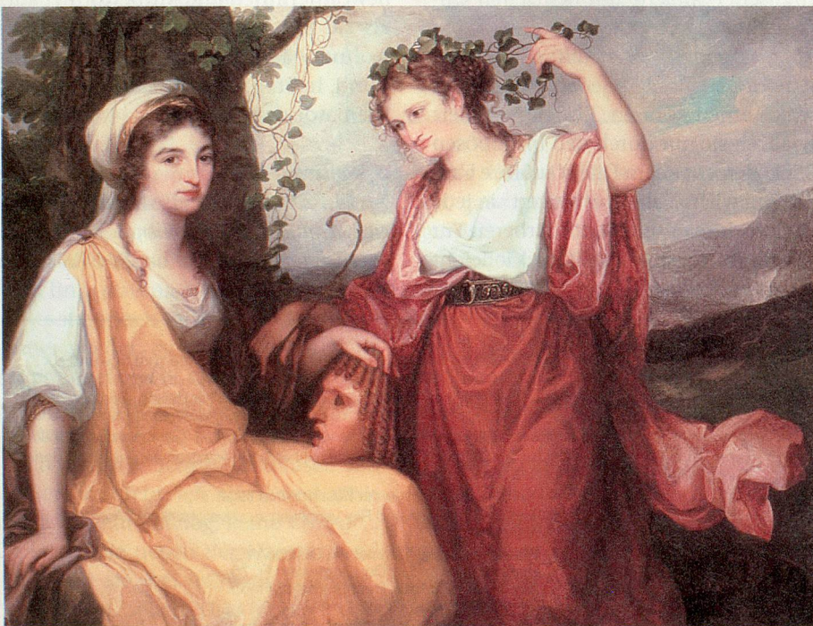
Nicht ohne Grund nennt man Angelika Kauffmann den weiblichen Raffael der Kunst und meint damit auch den Themenschwerpunkt, den sie auf mythologische Szenen legte. Hier ihr Bildnis der «Tragödie und Komödie» aus dem Nationalmuseum Warschau, zurzeit in Chur.

■ Die Ausstellung im Zoologischen Museum Zürich dauert bis zum 29. August. Öffnungszeiten: Di bis Fr 9–17 Uhr, Sa und So 10–16 Uhr, 01 634 38 38.