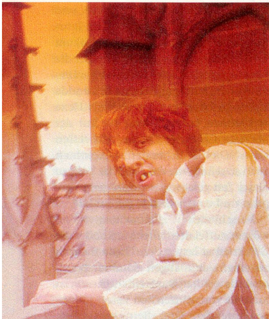
Der bucklige Quasimodo als Glöckner in Bern.

Bern war damals grösster Stadtstaat nördlich der Alpen und errichtete das bedeutendste Münster der Eidgenossenschaft. Das 15. Jahrhundert war vielerorts eine Zeit grosser Auseinandersetzungen, welche die Neuzeit nachhaltig geprägt haben. Neben den Theateraufführungen bringen historische Stadtführungen, Ausstellungen, Musikdarbietungen, Vorträge und Buchpublikationen das Leben von damals der Gegenwart näher. ny