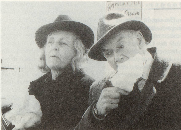
Die Hauptpersonen in der britischen Sitcom «Waiting for God»: Die grantige Diana und der lebenswerte Tom.

«Sie überlebt mit Gift, Rache und genereller Verachtung für jedermann», sagt Tom von seiner Zimmernachbarin Diana, mit der er den Lebensabend im «Bayview Retirement Home», einer Altersresidenz in Mittelengland, verbringt. Rabenschwarz ist der Humor von Diana, die das Altersheim als Pannestreifen des Lebens betrachtet, auf welchem sie nur auf den Abschleppwagen zu warten hat, der sie zur Müllhalde bringen wird. Ihr ist nichts und niemand heilig, ihrem beissenden Spott sind alle ausgesetzt: Der sparwütige und eitle Heimleiter Harvey Baines, dessen unattraktive Assistentin Jane, die hoffnungslos in ihren Chef verliebt ist, der sexbesessene Mitbewohner Basil, der ständig auf der Pirsch und hinter jedem Neueintritt her ist. Genauso böse ist Diana aber auch zu Toms langweiligem Sohn Geoffrey, der sich höchstens für die Holzmaserung norwegischer Kiefern interessiert, und zu dessen Frau Marion, die tablettensüchtig und alkoholabhängig ist. Auch «Seiner Merkwürden», dem Ortspfarrer, der seinen Glauben zu verlieren droht, gibt Diana ihren guten Rat: «Bloss weil sie Pfarrer sind, brauchen sie noch lange nicht jeden Bekloppten zu dulden.» Statt einer neuen Aufgabe möchte sie ihm deshalb lieber einen «Tritt in den Hintern versetzen». Doch auch vor sich selber macht Diana mit ihrem Spott nicht Halt: «Hinten Museum und vorne Mausoleum», urteilt sie vor dem Spiegel, als sie einen Hut für eine bevorstehende Beerdigung anprobiert. Dabei zählt sie sich