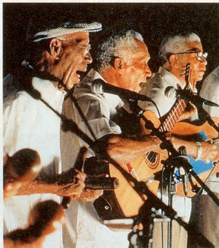
Mit kubanischer Populärmusik begeistern fünf alte Musiker auch in Europa.

Im Mai 1997 begleitete die holländische Filmerin Sonia Herman Dolz die charmanten Männer in Kuba bei den Vorbereitungen zu ihrer Europa-Tournee und bei den ersten Konzerten in England. Sie filmte sie im Kreise ihrer Familien und sprach mit ihnen über ihre Erinnerungen ans alte Kuba und seine Veränderungen. Daraus entstand ein 75-minütiger Dokumentarfilm von grosser emotionaler Wärme, der zudem gut unterhält.