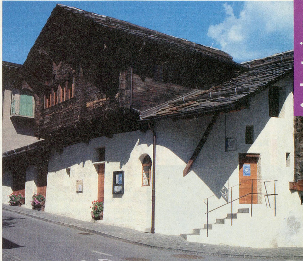
Ein schön renoviertes Bauernhaus aus dem 16. Jahrhundert beherbergt das Rebbau-Museum von Salgesch.

Vom Endpunkt des Rebweges dauert es zu Fuss rund 15 Minuten bis zum Bahnhof Sierre. Der Rebweg kann übrigens in beide Richtungen begangen werden. Der Höhenunterschied ist nicht gross.