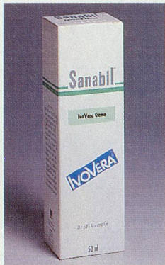
Feuchtigkeits-spender für die trockene Haut

Trockene Haut wird bei warmem Wetter und bei starker Sonneneinstrahlung zusätzlich strapaziert. Es wird ihr die für ihre Schutzfunktion notwendige Feuchtigkeit entzogen. Die Haut wird spröde, verliert ihre natürliche Spann-