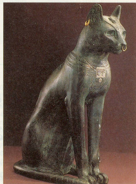
«The Gayer-Anderson-Cat» – Bronze-Katze aus dem alten Ägypten (30 v. Chr.).

Die ersten Katzen hielten sich Damen von Jericho vor 7000 Jahren. Diese Katzen waren aber vermutlich noch keine Haustiere. Die Geschichte der Hauskatze-Mensch-Beziehung ist dagegen mindestens 4500 Jahre alt. So alt ist nämlich ein ägyptisches Grabbild, das bereits eine offensichtlich zahme Katze mit Halsband zeigt. Auf jüngeren ägyptischen Wandbildern ist die Katze häufig als Jagdgefährtin oder als stille Begleiterin an festlichen Anlässen abgebildet. Dann erschien im grossen Reigen tiergestaltiger Götter und Göttinnen Ägyptens auch die katzenköpfige Bastet. Mit der sanften Göttin Bastet wurden auch die Katzen verehrt und verbreitet.