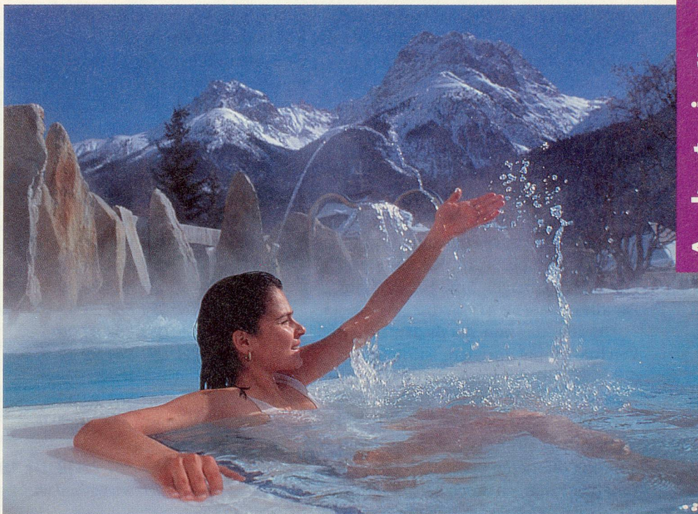
Der Gast findet Entspannung im bekannten Thermalbad «Bogn Engiadina» in Scuol.

Das malerische 200-Seelen-Dorf Guarda mit seinem intakten Dorfbild und den mit wunderschönen Sgraffiti geschmückten Häusern verfügt über weitgehend dieselben Wintersportmöglichkeiten wie Zernez. Statt einer Kunstgibt es hier aber eine Natureisbahn, und Besucher können nach Wunsch das Dorf und seine Umgebung auf einer Pferdeschlittenfahrt kennen lernen. Von Guarda aus sind es nur 20 Minuten