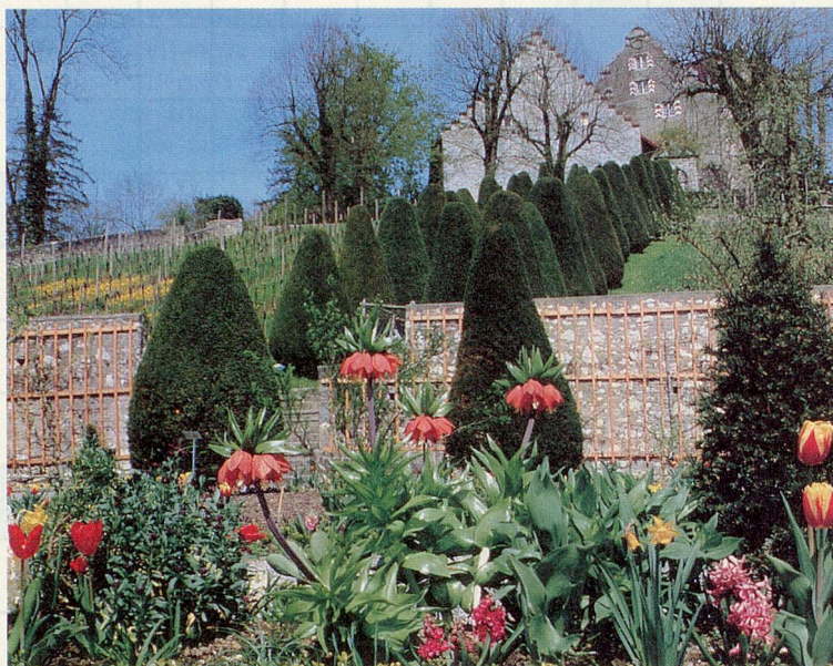
Blick vom barocken Lust- und Nutzgarten im Schloss Wildegg.

Unter dem Titel «Zu Lust und Nutz» macht der vierte Rundgang aufmerksam auf alte, heute seltene Gemüse-