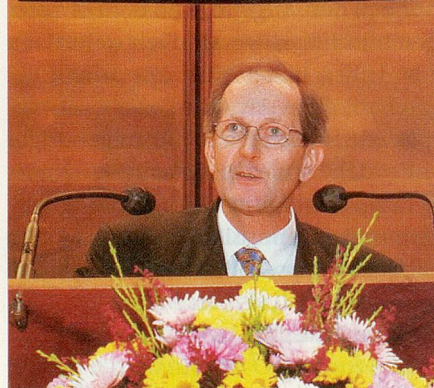
Bundesrat Joseph Deiss: «Wenn wir den Dialog suchen und finden, brauchen wir vor der Zukunft keine Angst zu haben.»

lang auf Tuchfühlung zu gehen. Im Übrigen war auch die von seiner Vereinigung in der Ehrenhalle der Universität organisierte Hobbyausstellung ein voller Erfolg. Sie wurde während einer Woche täglich von bis zu 300 Personen besucht.