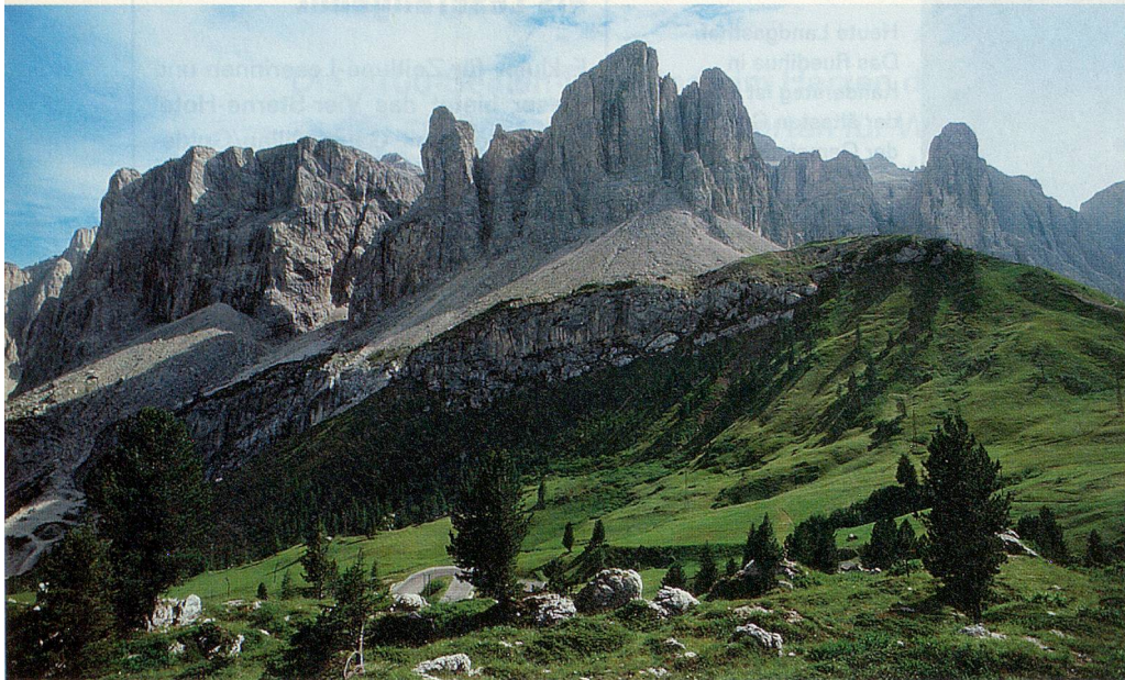
Die Jubiläumsreise des Schweizerischen Invalidenverbands führt ins Südtirol – mit einem Abstecher zu den Dolomiten.