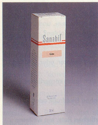
Unterstützt die natürliche Regeneration der Haut.

Jede Haut altert. Manche schneller, manche langsamer. Der Alterungsprozess hängt davon ab, wie gut sich die Haut regenerieren kann und wie stark ihre Widerstandskraft gegen schädigende Einflüsse ist. Der natürliche Alterungsprozess, bedingt durch eine verlangsamte Zellteilung, kann durch den Einsatz von geeigneten aktiven Stoffen hinausgezö-