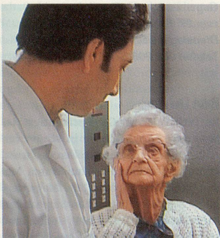
Christian Davis Begegnung der Kulturen in einem Schweizer Altersheim.

«ID SWISS» ist ein Schweizer Dokumentarfilm in sieben Episoden, der durch seine persönliche und subjektive Betrachtungsweise einer jüngeren Generation von Schweizer Filmemacherinnen und