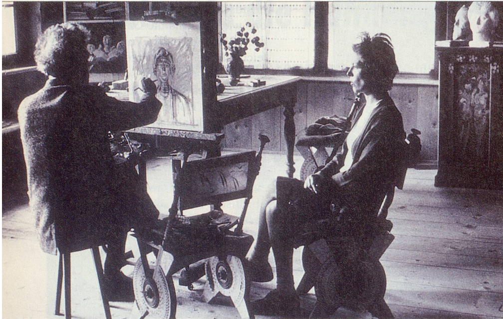
Alberto Giacometti in seinem Atelier in Maloja, 1960.