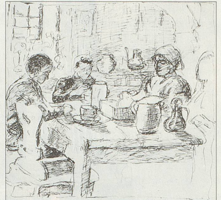
Mutter mit Kindern am Küchentisch, 1918. Feder mit Tinte auf Papier.