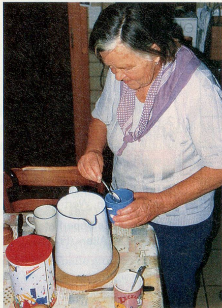
Bereitet für «ihre» Bergbauernfamilie das Frühstück vor: Seniorin im Sozialeinsatz.