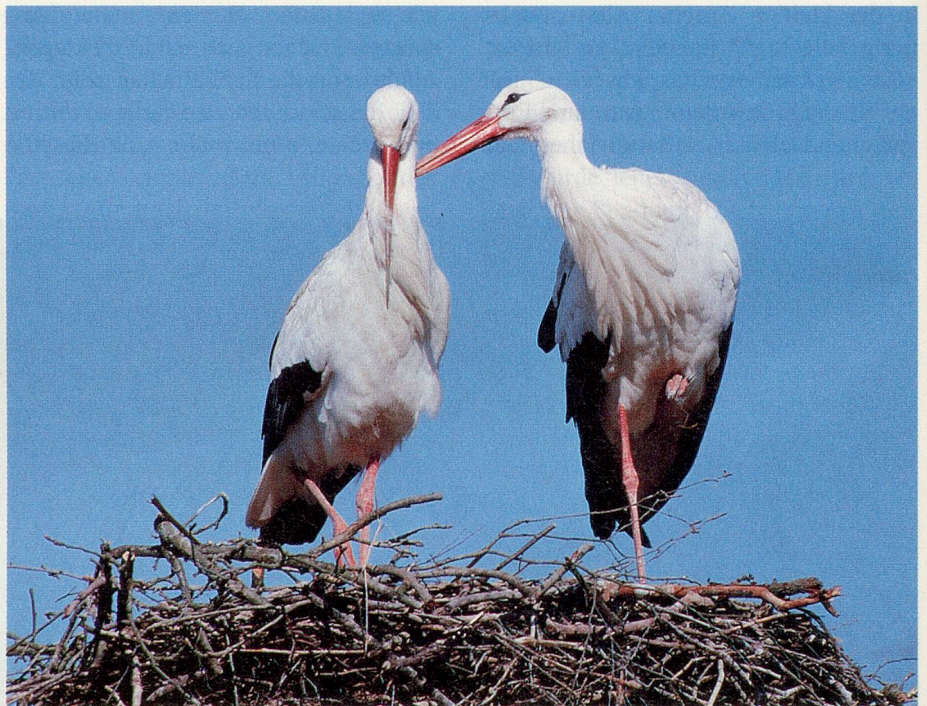
Störche brüteten ursprünglich auf Felsen und alten Bäumen, heute eher auf Hausdächern, Kirchtürmen und Schornsteinen. Auf dem Bild zwei Störche in ihrem etwa anderthalb Quadratmeter grossen Nest.

Die Störche selber bekommen ihre Jungen hoch oben auf Dachfirsten, Kirchtürmen, Schornsteinen und Baumkronen. Dort, über dem Abgrund, auf knapp anderthalb Quadratmetern Nest-