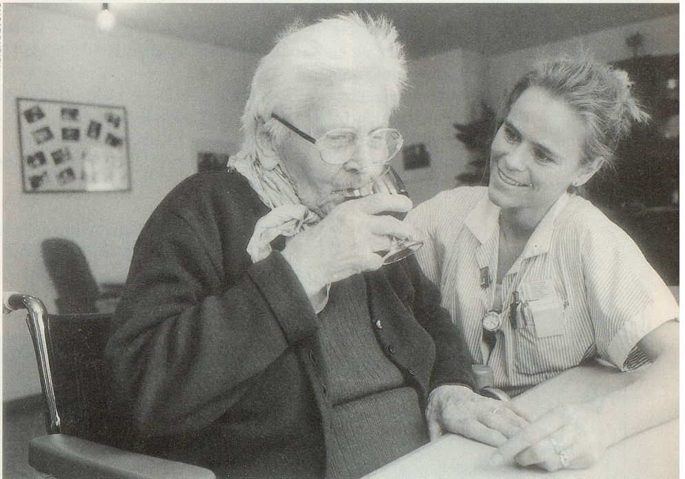
An das Pflegepersonal werden von allen Seiten sehr hohe Ansprüche gestellt.