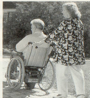
VIAMOBIL – einfache Schiebehilfe

Service-Center, 8637 Laupen ZH Telefon 055 246 46 44