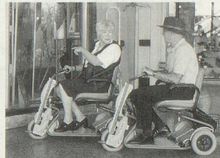
SUPERLIGHT, der tragbare SCOOTER.

«Beweglichkeit spielt in unserem Leben eine tragende Rolle»