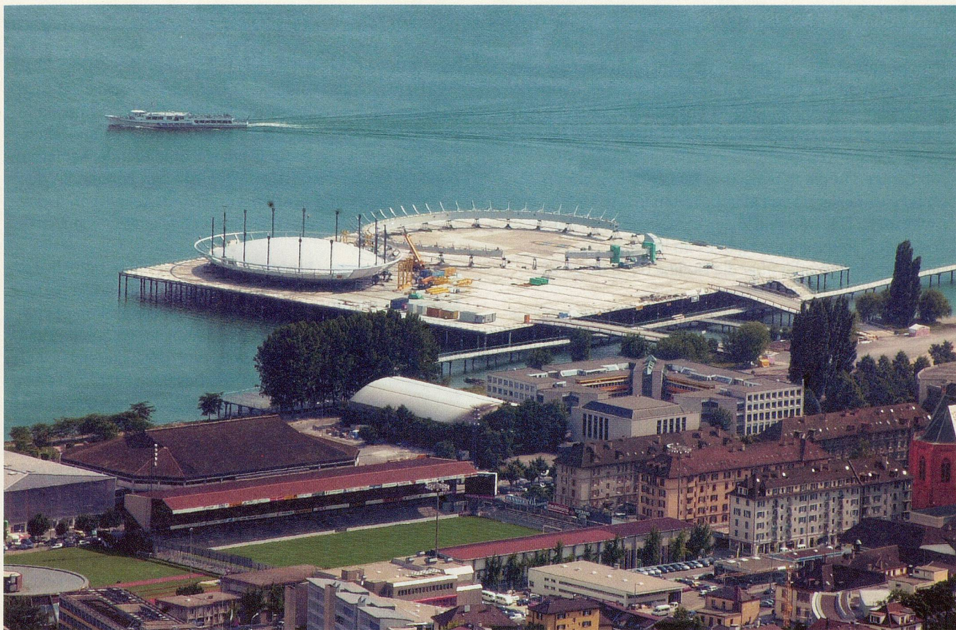
Die künstlichen Plattformen ragen vor allen vier Expo-Städten in den See hinaus – hier eine Aufnahme von Neuenburg.