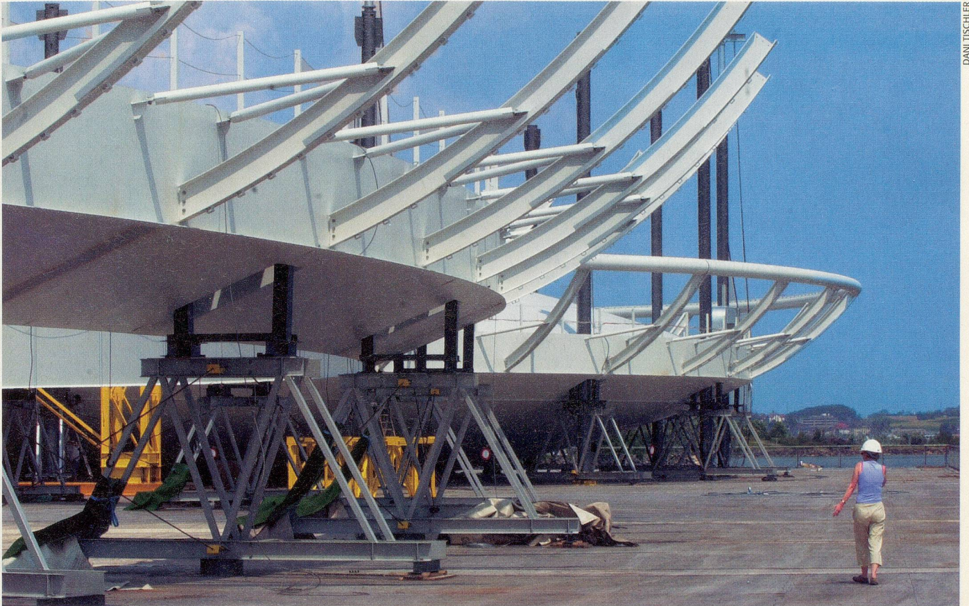
Auf allen Arteplages entstehen die Wahrzeichen der Expo.02: In Neuenburg sind es die bis zu zwanzig Meter hohen «Galets».

sehen: die künstliche Wolke, die dicht über dem Wasserspiegel hundert Meter vom Seeufer entfernt schwebt. Aus einer zwanzig Meter hohen Metallkonstruktion zerstäuben 33 000 Düsen Seewasser zu einer Wolke, in welcher die Sichtweite manchmal weniger als einen Meter beträgt. Seit Wochen wird bei jeder Witterung mit der Anordnung der Düsen experimentiert. Über der Wolke wird die «Engelbar» dem Publikum einen Blick über das ganze Gelände gewähren.