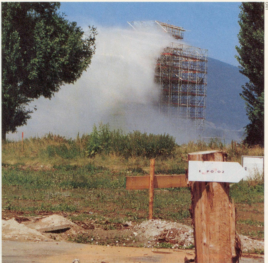
Noch wird experimentiert mit der künstlichen Wolke über der Arteplage Yverdon.

Jede veröffentlichte Antwort wird mit 20 Franken belohnt. Einsendeschluss ist der 8. Oktober 2001.