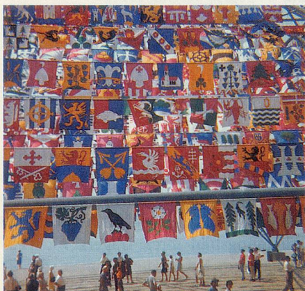
Erinnerungen an die Expo 1964.