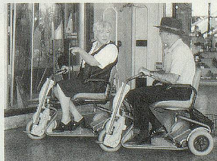
SUPERLIGHT, der tragbare SCOOTER.

«Beweglichkeit spielt in unserem Leben eine tragende Rolle»