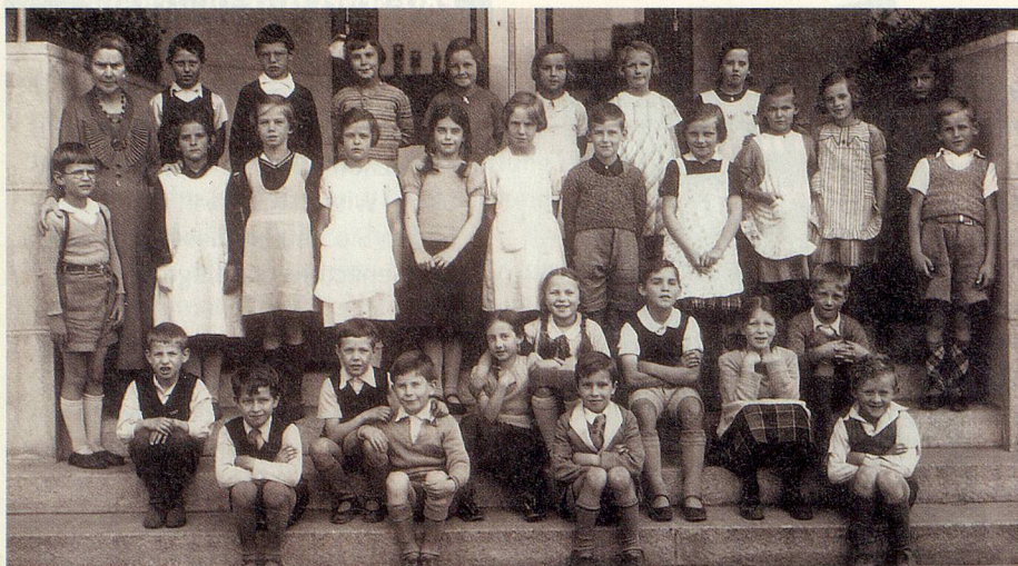
Klassenfoto der Primarschule Länggasse Bern.