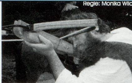
Regie: Monika Wild

Jeden Donnerstag vom 21. Juni bis 6. Sept. Jeden Samstag vom 28. Juli bis 8. Sept. Spielbeginn jeweils 20.00 Uhr Achtung! An der Nachmittagsvorstellung vom 22. Juli geniessen Personen im Rentenalter 50% Ermässigung! Spielbeginn 14.30 Uhr