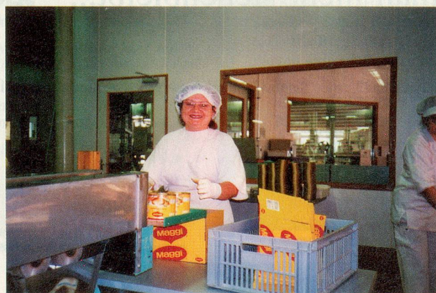
Diese Arbeit wird bald im Ausland ausgeführt.