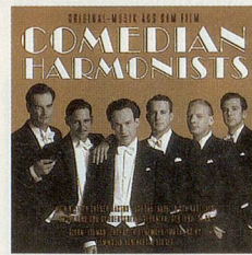
EMI Electrola, CD 4 93146 2, CHF 30.-