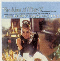
BMG Music, 2362-2-R, CHF 25.20