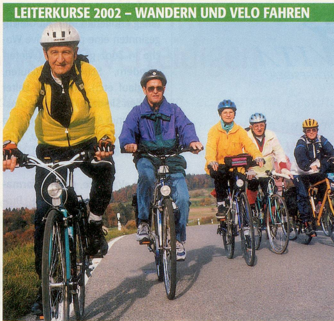
LEITERKURSE 2002 – WANDERN UND VELO FAHREN

Ferien- und Sportangebote. Vom 31. August bis 7. September findet in Saas-Grund VS die diesjährige Wanderwoche statt. Das Wandergebiet des Saastales ist einmalig. Heute genießen die verschiedenen Höhenwanderungsetappen «Tour Monte Rosa» europäische Berühmtheit. Wer hätte hier nicht Lust, mit einer aufgestellten Wandergruppe eine Woche zu verbringen? Anmeldeschluss ist der 25. März 2002. Detailprogramme erhalten